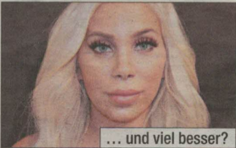
... und viel besser?