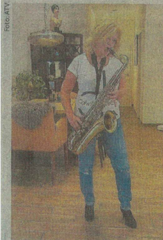
Für die ATV-Kuppellei „Alles Liebe“ wird wieder gedreht.